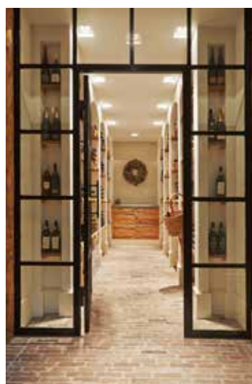
Entree naar de wijnopslag.