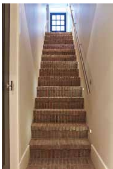
Gemetselde trap naar de kelder.