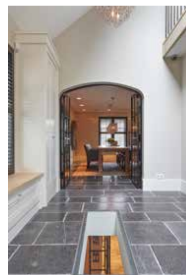
De doorkijk naar de kelder vanaf de begane grond.