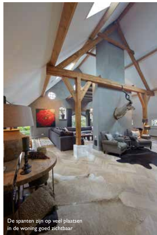
De spanten zijn op veel plaatsen in de woning goed zichtbaar