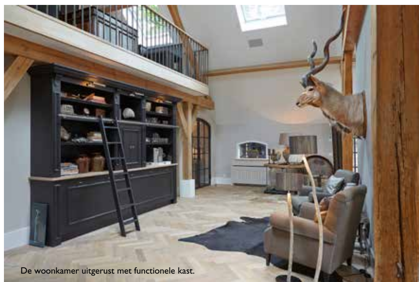
De woonkamer uitgerust met functionele kast.

“We hebben in overleg met Edgar vooral gekeken naar de functies die we in huis wilden hebben, naast de traditionele functies zoals de woonkamer, keuken en slaapkamer” zegt Bert. “Toen zijn er een aantal wensen bijgekomen. Onder andere om een kelder te hebben. Dat leidde weer tot de discussie ‘kleine of grote kelder’. Het werd uiteindelijk een grote kelder omdat we daarmee een aantal wensen als een bioscoopje, fitnessruimte en wijnkelder konden vervullen.”