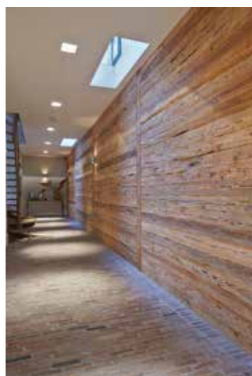
Een bijzondere houten wand van handgehakt vuren delen.